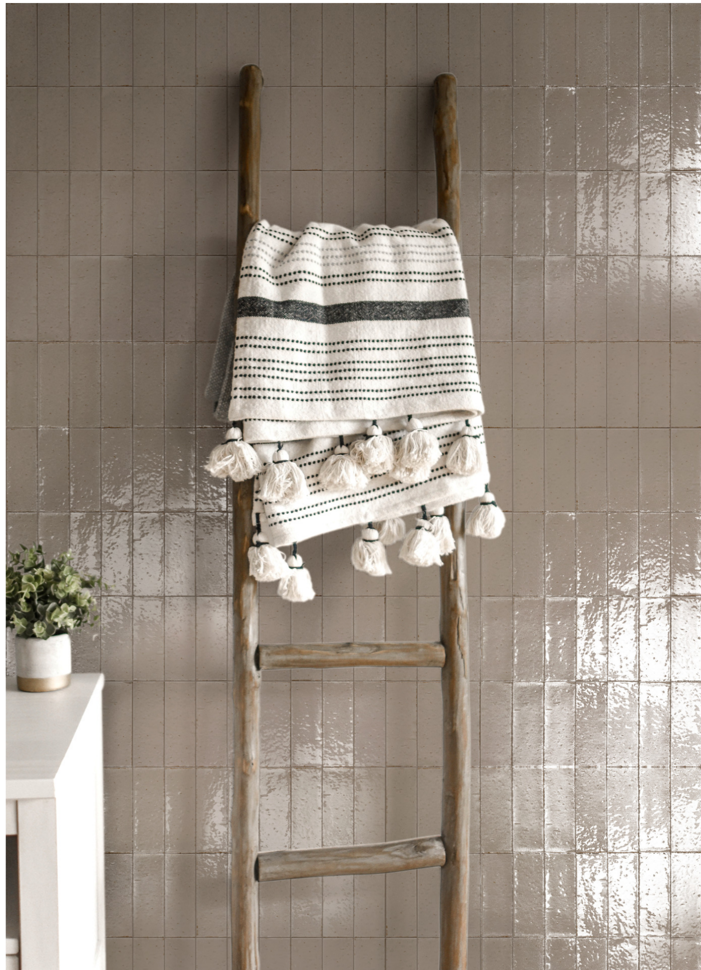
RAEW Glacé Mastice Glossy 7x20cm