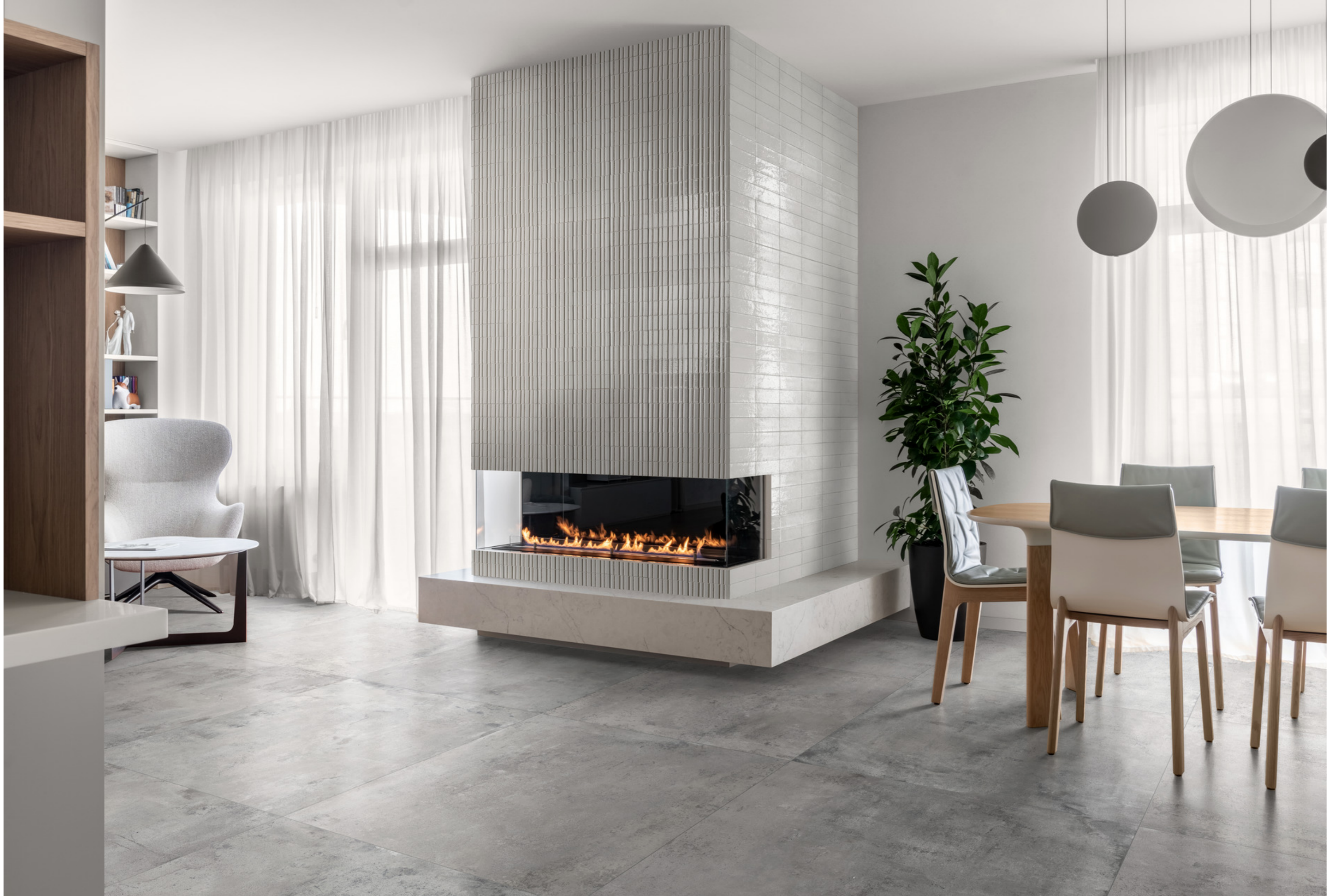
RAEL Glacé Bianco Glossy Struttura Rayé 7x20cm - RAEV Glacé Bianco Glossy 7x20cm - RAQ1 Clayton Iron Rt 100x100cm