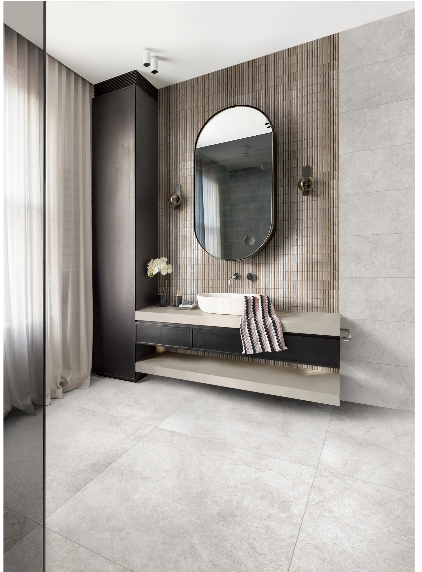
RACU Richmond Ivory Rt 33x100cm - RAEM Glacé Mastice Glossy Struttura Rayé 7x20cm - RALJ Richmond Ivory Rt 100x100cm