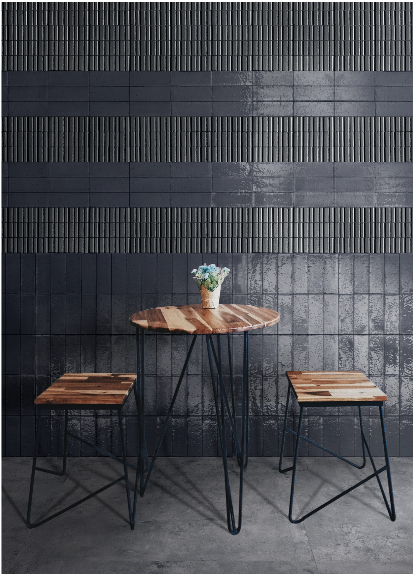
RAER Glacé Blu Notte Glossy Struttura Rayé 7x20cm - RAF0 Glacé Blu Notte Glossy 7x20cm - RAQ2 Clayton Smoke Rt 100x100cm