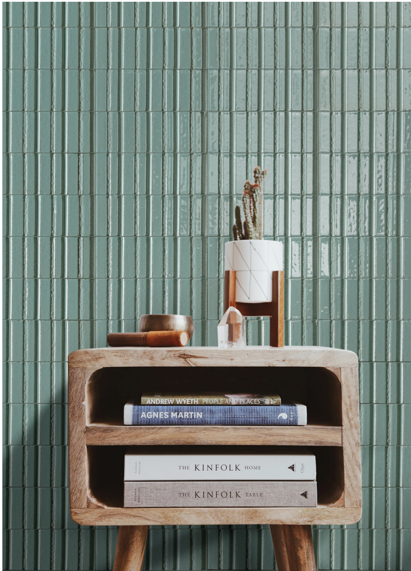
RAEP Glacé Turchese Glossy Struttura Rayé 7x20cm