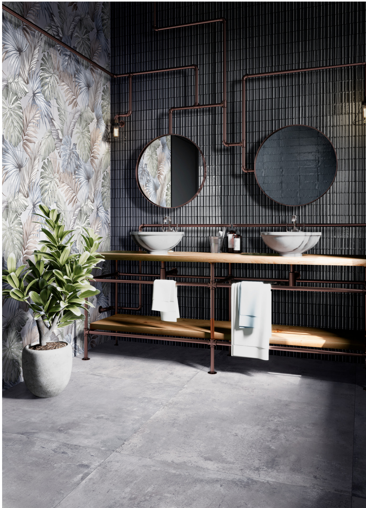
RAER Glacé Blu Notte Glossy Struttura Rayé 7x20cm - RAQ1 Clayton Iron Rt 100x100cm - RCR2 Clayton Decoro Mural Touch Set Rt 33x100cm