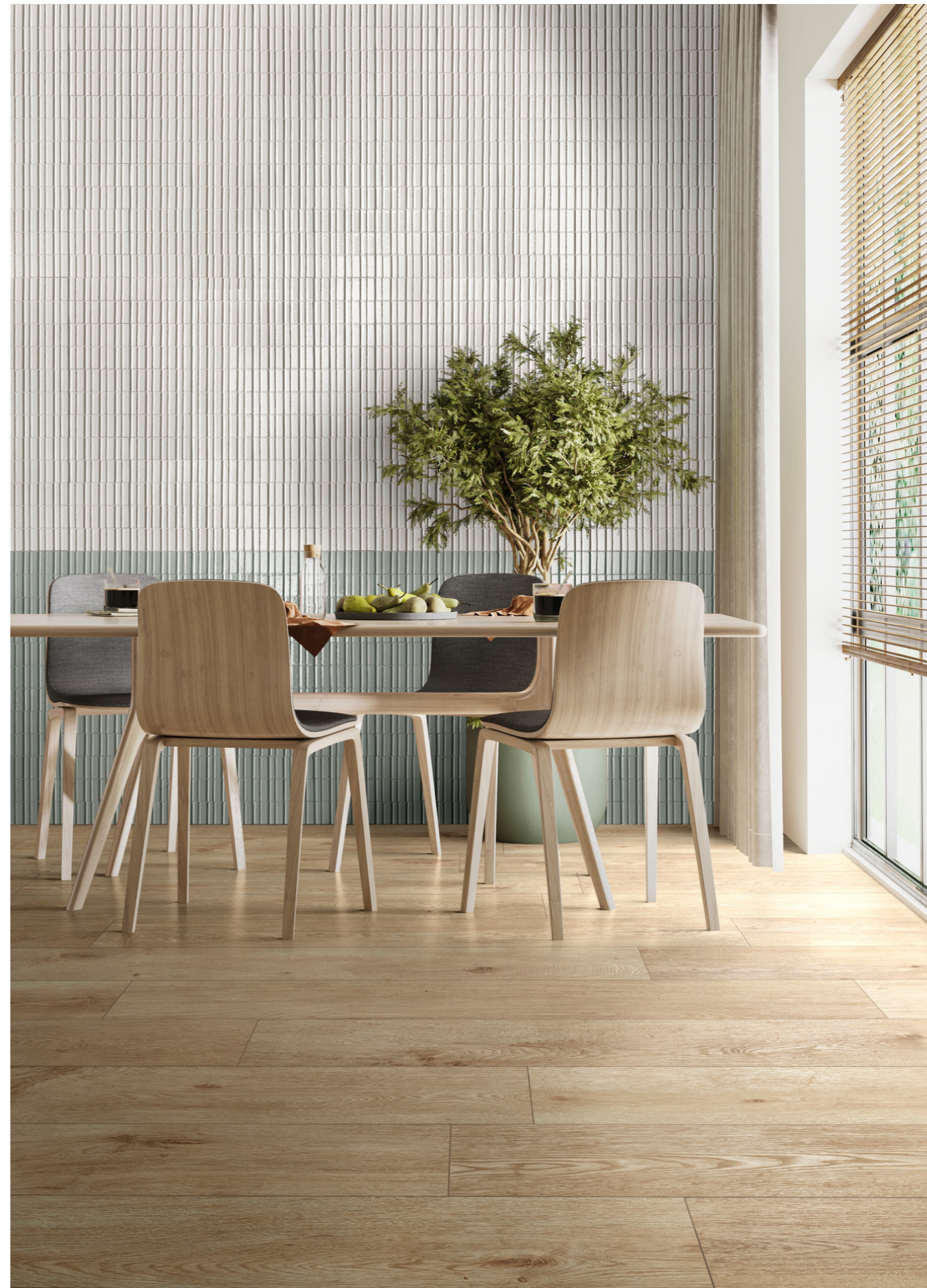
RADL Inedito Avorio Rt 25x150cm - RAEL Glacé Bianco Glossy Struttura Rayé 7x20cm - RAEQ Glacé Avio Glossy Struttura Rayé 7x20cm