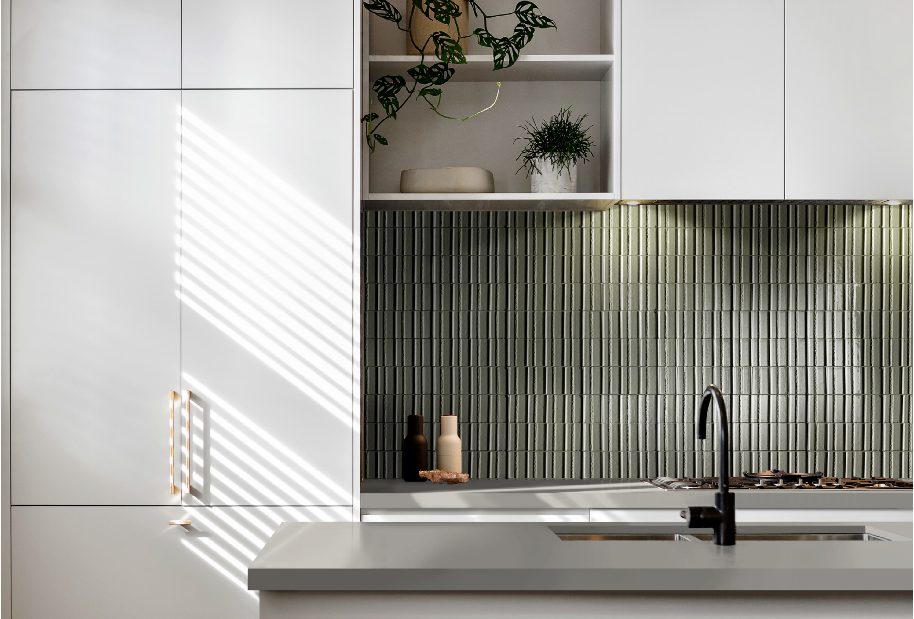
RAEN Glacé Muschio Glossy Struttura Rayé 7x20cm