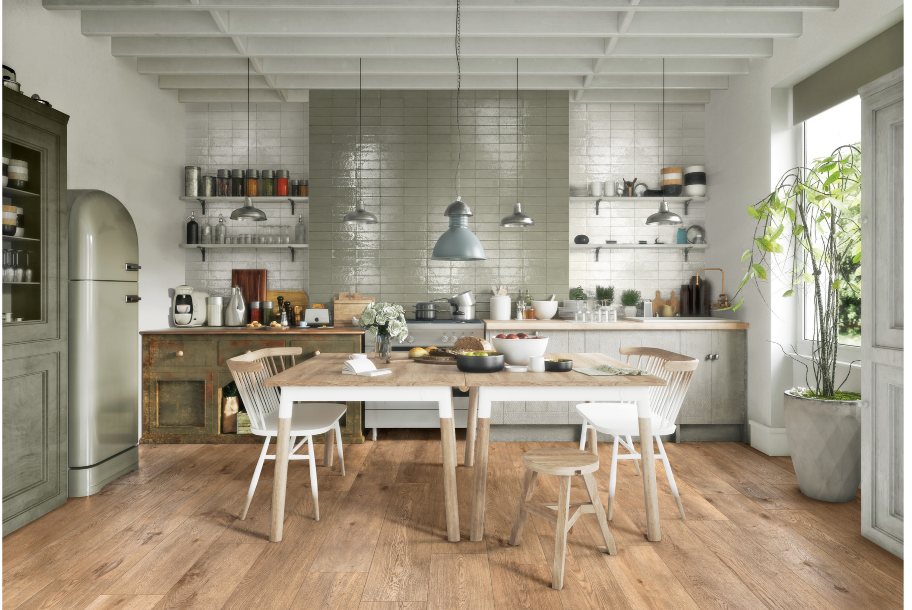
RADN Inedito Nocciola Rt 25x150cm - RAEV Glacé Bianco Glossy 7x20cm - RAEX Glacé Muschio Glossy 7x20cm