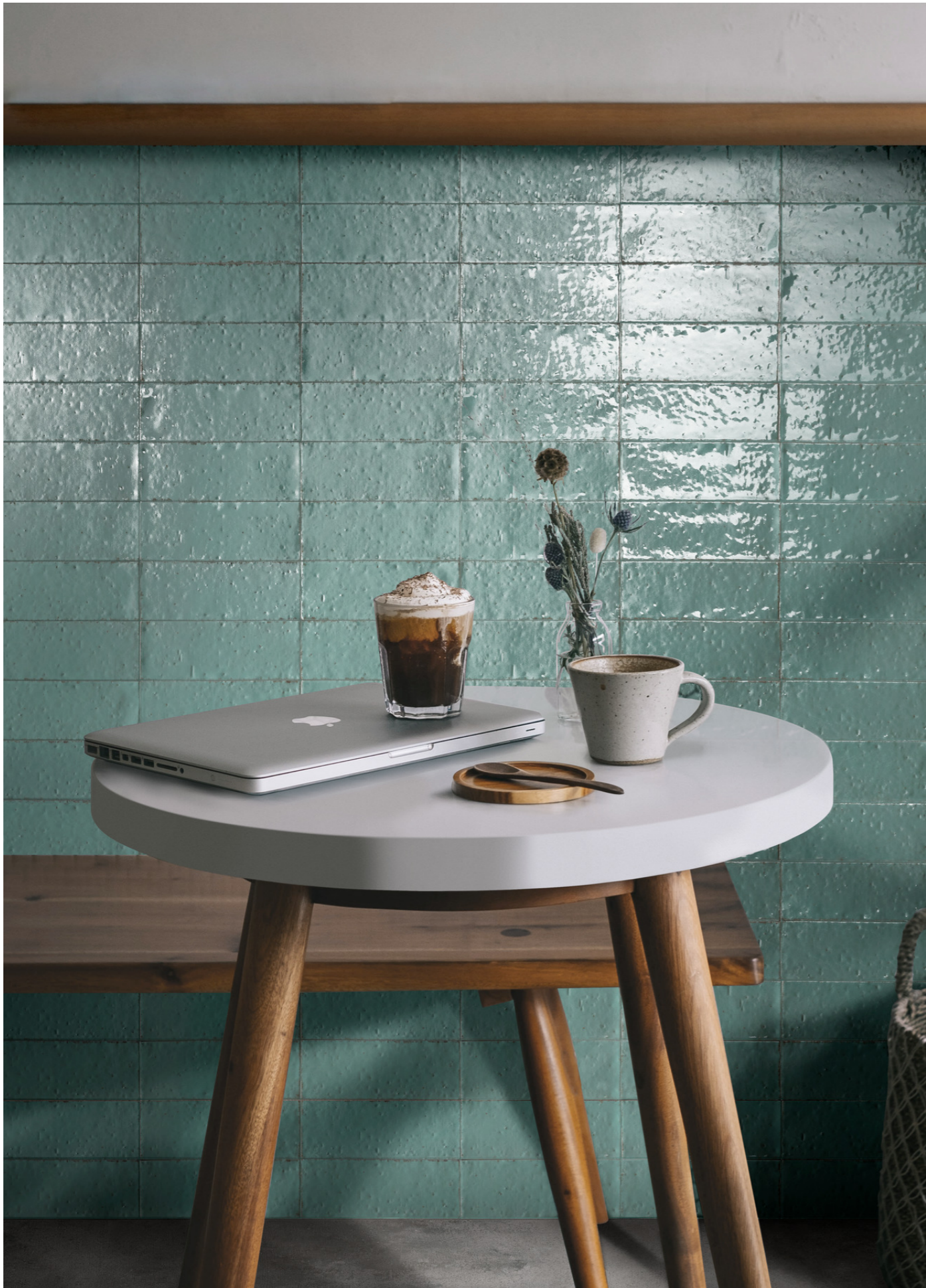
RAEY Glacé Turchese Glossy 7x20cm - RAQ2 Clayton Smoke Rt 100x100cm